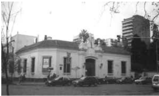
Museo de Arte Español Enrique Larreta

Conoce todos los vientos de Congreso hasta Lacroze, y en la vieja estación arrastra sus cadenas y un dolor.