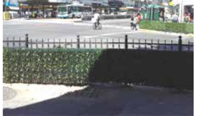
ESQUINA DE CONGRESO Y CABILDO