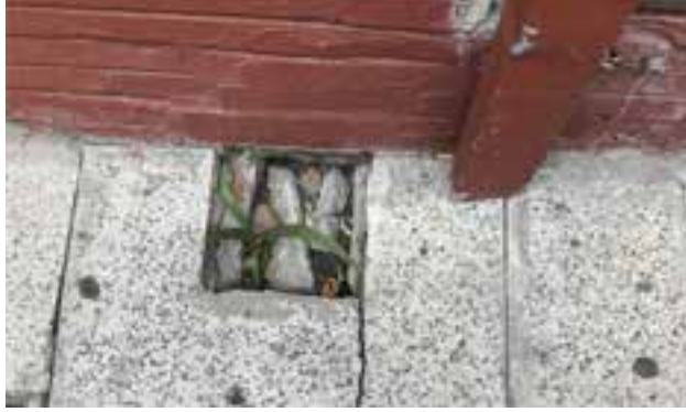
VEREDAS ROTAS II