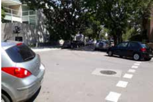
NO HAY LUGAR PARA ESTACIONAR