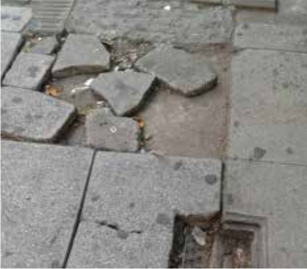
VEREDAS ROTAS I