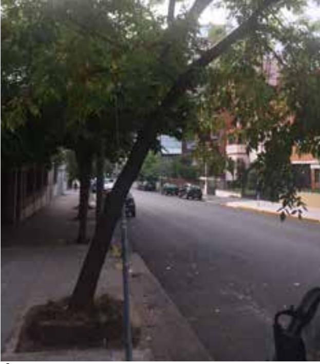
ÁRBOL TORCIDO EN ZAPIOLA AL 1600

Enviá tus comentarios. Por carta: Amenábar 2531. Por Teléfono o Whatsapp: 15-4409-3466. Por Email: lectores@mibelgrano.com.ar