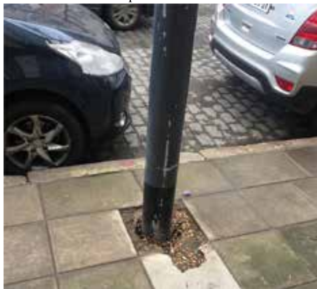
VERÓNICA: ¿Quién se ocupa de las veredas de Colegiales? Desde el mes abril están rotas por el cambio del alumbrado público.

Hacia apenas unos meses el GCBA la había renovado. ¡Tengan en cuenta que el arreglo lo pagamos los ciudadanos con nuestros impuestos!