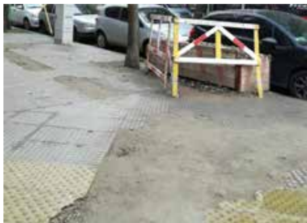
GEMA: Estamos esperando que Edenor vuelva la vereda a su estado original en Migueletes y Virrey del Pino.

Hacia apenas unos meses el GCBA la había renovado. ¡Tengan en cuenta que el arreglo lo pagamos los ciudadanos con nuestros impuestos!