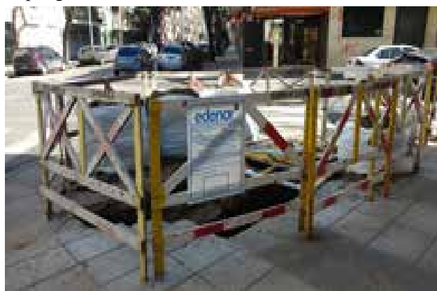
ALBERTO: Un lindo y peligroso agujero dejaron en la esquina de Amenábar y Pedro I. Rivera. Hay un cartel que no dice nada, ni la fecha de comienzo de los trabajos, ni la fecha de finalización y tampoco figura en que día van a ir a reparar la vereda. Para romperlas son rápidos, pero para arreglarlas, se toman su tiempo.