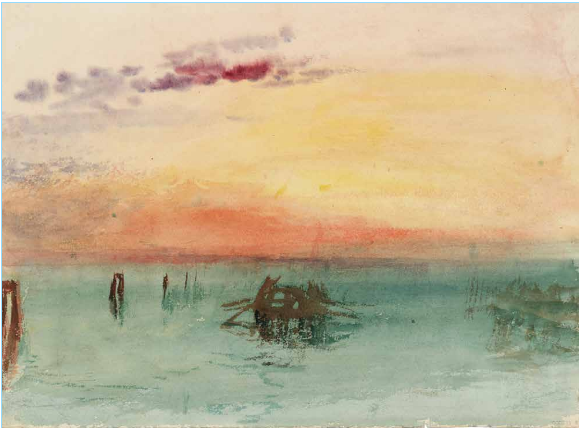
Venecia, vista a través de la laguna en el crepúsculo, 1840 Acuarela sobre papel, 24,4 x 30,4 cm