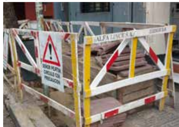
ARIEL: Es fabuloso que pongan un cartel que dice: “Señor peatón circule con precaución”, ahora bien yo les preguntaría: ¿Por dónde quieren que pasemos? ¿No se dan cuenta que no dejan lugar en la vereda para circular con o sin precaución?