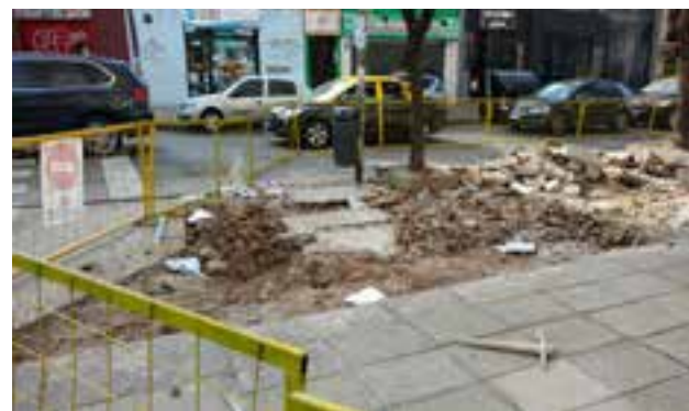
DANIEL: En Juramento y Vidal están reparando la vereda. Espero que peguen las baldosas como corresponde y podamos pisar tranquilos durante mucho tiempo sin que se despeguen.