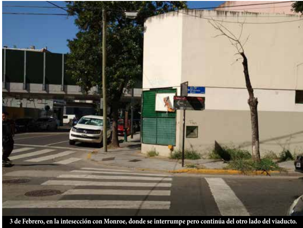
3 de Febrero, en la intesección con Monroe, donde se interrumpe pero continúa del otro lado del viaducto.

El nombre elegido quiso rememorar la batalla del 03 de febrero de 1852 ocurrida en los campos de Monte Caseros, provincia de Buenos Aires, (conocida como "la Batalla de Caseros"), entre las fuerzas de la Confederación Argentina lideradas por Juan M. de Rosas y la Coalición formada por un país extranjero (el entonces Imperio del Brasil), junto a argentinos emigrados en Montevideo y opositores al gobernador de Buenos Aires, liderados por el General Justo J. de Urquiza. Luego de un combate encarnizado, la batalla del 3 de febrero de 1852 dio como resultado la derrota de las fuerzas de la Confederación Argentina por la de los Aliados argentinos-brasileros, y tuvo como consecuencia inmediata la caída del gobierno (o dictadura) de Juan Manuel de Rosas y su exilio en el extranjero. Muchos de los vencidos fueron fusilados o trasladados como prisioneros. Pocos días después de la batalla de Caseros, el Gral. Urquiza y el ejército brasilero hicieron su entrada triunfal