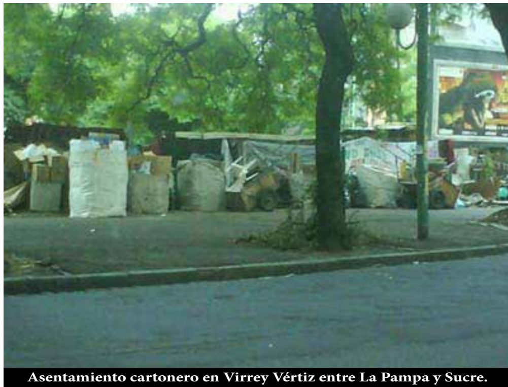
Asentamiento cartonero en Virrey Vértiz entre La Pampa y Sucre.

Hoy se cumplen 2 años del brutal desalojo de los cartoneros asentados en Pampa y la vía, y no tengo ganas de olvidar esa jornada tan llena de heroísmo por parte de un puñado de trabajadores cartoneros, que defendían su derecho a trabajar, acompañados por muchos vecinos de Belgrano y de otros barrios cercanos. Fue una lucha desigual. La bestial fuerza que mandó a reprimir el "eficiente" Gobierno de la Ciudad a ese pequeño e inofensivo grupo de resistencia logró su objetivo: apaleó sin diferenciar a hombres, mujeres o niños, destrozó todas las pocas pertenencias de los cartoneros, incluyendo cochecitos de bebés, mamaderas, pañales, etc. También secuestraron los carros con