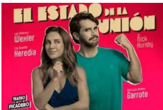
EL ESTADO DE LA UNIÓN