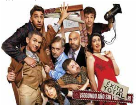
LA FUNCIÓN QUE SALE MAL