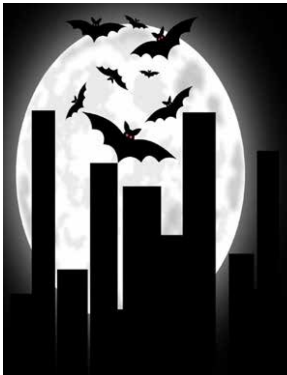
contacto con él.

Son animales inofensivos, aunque pueden transmitir enfermedades como la rabia. Cuando un murciélago enferma de rabia, se desorienta y choca con objetos diversos al volar (postes, árboles, etc.), cambia sus hábitos y vuela durante el día o se pueden encontrar caídos en el suelo.